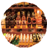
酒类综合 WINE & SPIRITS