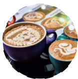
咖啡与茶 COFFEE AND TEA