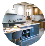
餐饮设备 CATERING EQUIPMENT