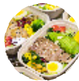
团餐供应链 CATERING SUPPLY CHAIN