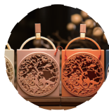
礼品及生活方式 SMART GIFT & LIFE SHOW