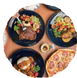
食品及餐饮食材综合 FOOD & CATERING INGREDIENTS