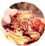
烘焙甜点及轻餐 BAKING AND LIGHT MEAL