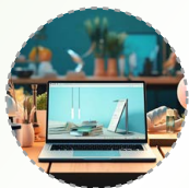
智能办公设备及整体方案