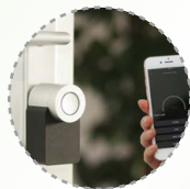
智能通行 安防管理