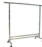
M68 | 轮式方管衣架 Wheel Coat Hanger 1200 x 500 x 1400-1900ht mm