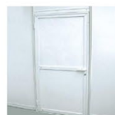
MM02 | 铝门 Lockable Door 950 x 1910ht mm