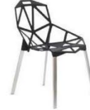
C88C 黑色合金椅子 Black Stainless Chair 550 x 570 x 810ht mm