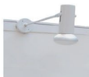
ML002 | 长臂射灯 Longarm Spotlight 100W