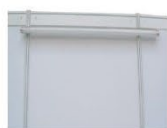
ML006 | 日光灯 Fluorescent Tube (1200L mm) 40W