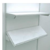
MS02/03 | 平层板 / 斜层板 Flat Shelf / Sloped Shelf 1000 x 300W mm