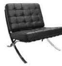
S03C 欧意沙发 Sofa C 800 x 770 x 760ht mm