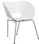
C30B 贝壳椅 (白) Vada 600 x 600 x 780ht mm