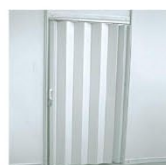
MM01 | 折门 Plastic Folding Door 850 x 2000ht mm