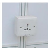
ML0004 | 电源插座 Power Socket Max. 500W