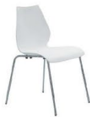
C59B 白蒹葭椅 Glisso (White) 480 x 550 x 800ht mm