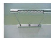
ML010 | 照画灯 Wall Lamp 60W