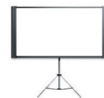
MA04 | 屏幕 Projector Screen