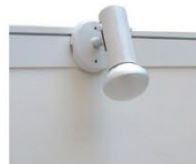
ML001 | 短射灯 Spotlight 100W