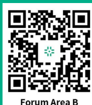
Forum Area B