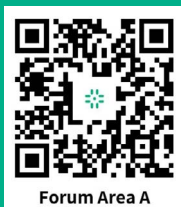
Forum Area A

* We recommend using headphones for optimal listening experience during the live translation.