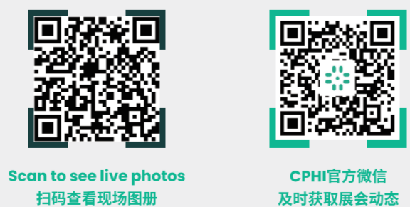
Scan to see live photos 扫码查看现场图册 CPHI官方微信 及时获取展会动态

Venue Address / 展馆地址: No.2345 Longyang Road, Pudong New District, Shanghai 浦东龙阳路2345号 Opening Hours / 参观时间: 19 June 6月19日 09:30 - 18:00 20 June 6月20日 09:00 - 18:00 21 June 6月21日 09:00 - 15:30