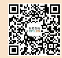
制药在线官方微信 洞察制药新趋势