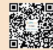
CPhI官方微信 及时获取展会动态