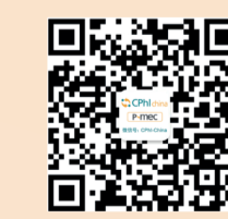
CPhI官方微信 及时获取展会动态