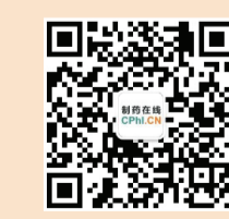
制药在线官方微信 洞察制药新趋势